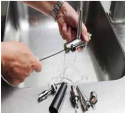
Abb. 5: Zerlegte Zapfhähne (Bier, Postmix) zur gründlichen Reinigung