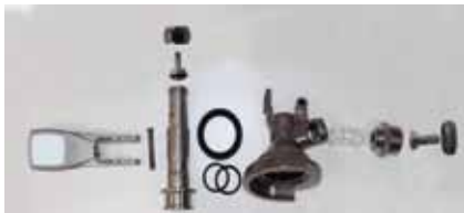
Abb. 6: Zerlegter Zapfkopf zur gründlichen Reinigung