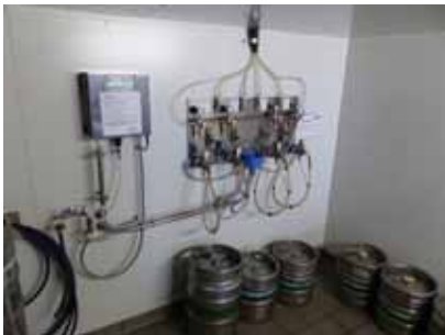
Abb. 9: Automatisches chemisches Reinigungsgerät für Leitungen (Dosiervorrichtung und Steuereinheit)

Beispielhaftes chemisches (Abb. 9) und chemisch-mechanisches Reinigungsgerät (Abb. 10).